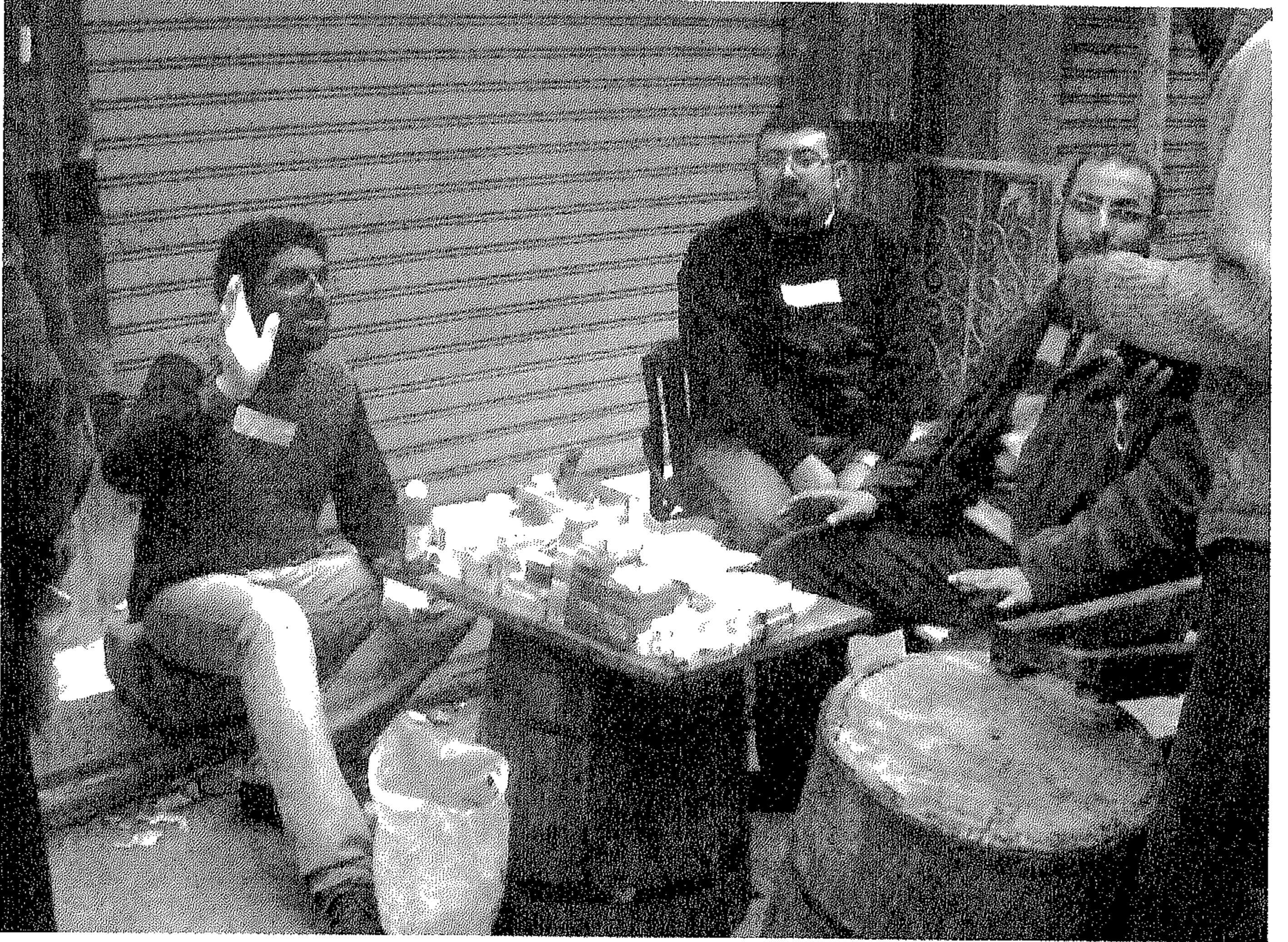
الوحدة الطبية رقم 2 بين مطعم كنتاكي وشركة الطيران القطرية